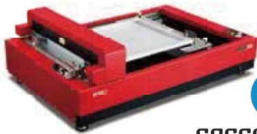
NEW 2021年春発売予定 GOCCOPRO QS1836

高額部品であるTPHが故障した場合、パーツ代金を無償 ※2 で交換いたします。 万が一の費用負担が少ないので、安心してお使いいただけます。